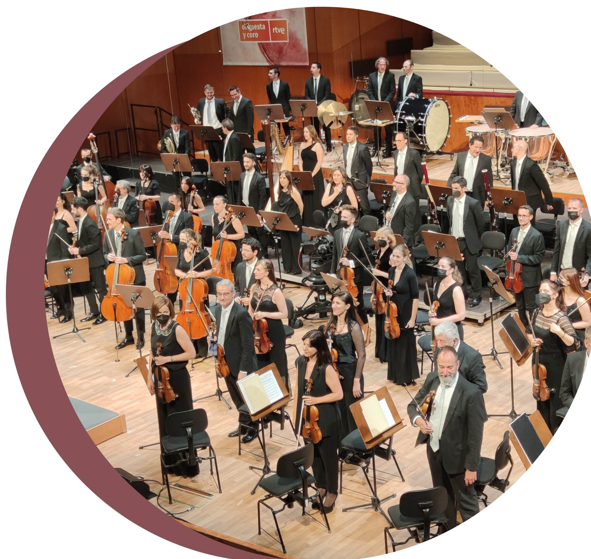
Orquesta Sinfónica RTVE

ORQUESTA SINFÓNICA RTVE El amor del hidalgo caballero